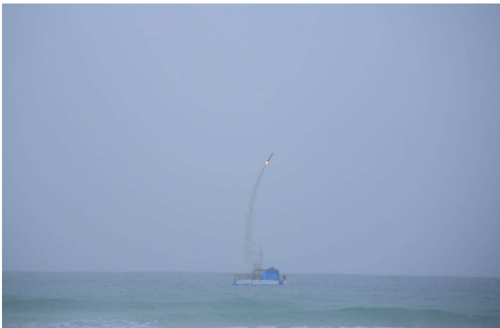
2019年11月22日（金）洋上より小型ロケット打ち上げ。

そして、さらに大型のロケットの打上げに対応可能な、「Astrocean Mini」（アストロオーシャン ミニ）の実証をスタートさせます。